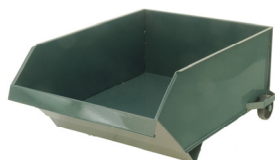
Chariot à charbon