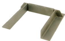
Limitation de feu